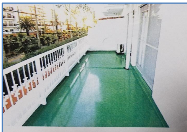
2階手摺取替・ベランダ防水