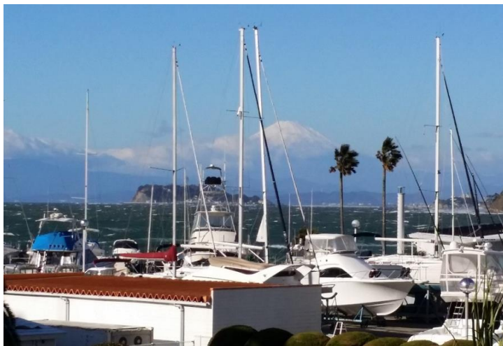
逗子ワシントニヤ館客室より撮影 江の島と富士山