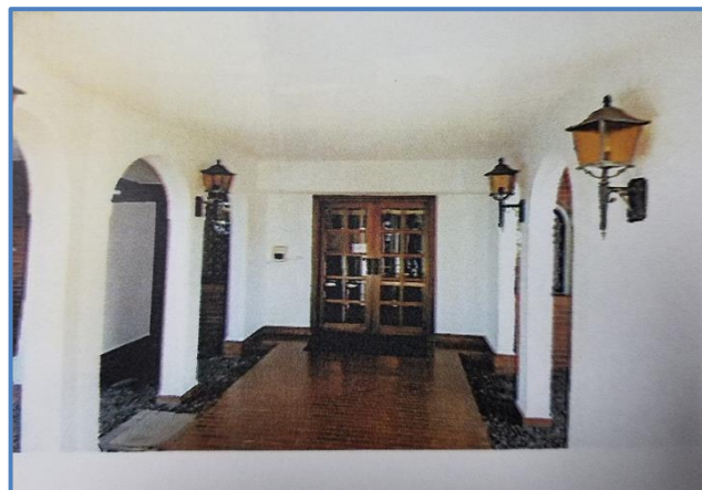
入口自動ドア前改修