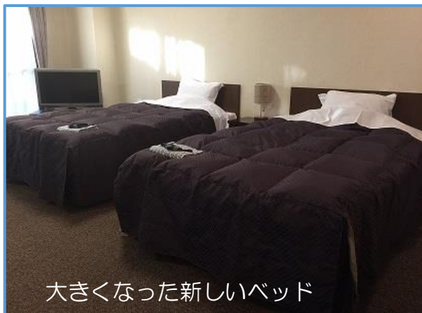
大きくなった新しいベッド