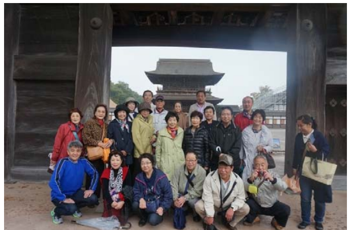
瑞巖寺総門前にて