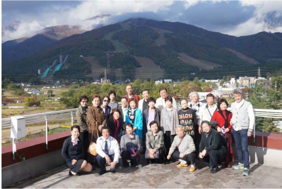
太洋白馬ハイツ屋上より