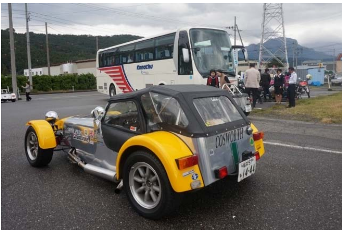
神奈中デラックスバスと手作り自動車