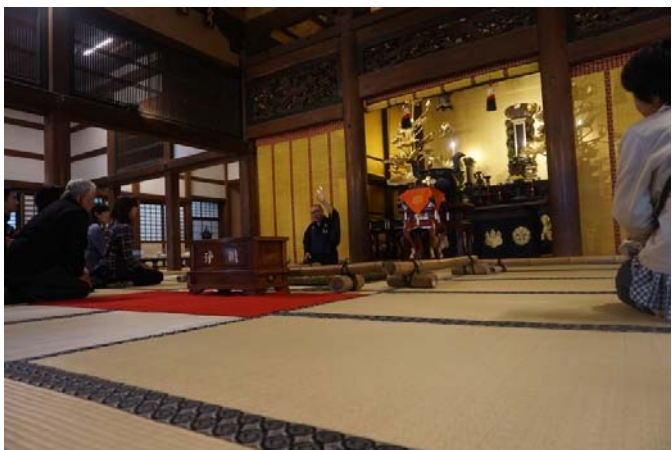
瑞巖寺での講談のような前田家のお話