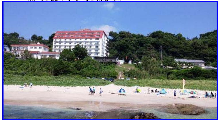
白浜全景(大洋マンション)