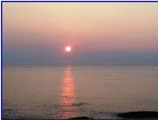
砂浜から見た朝日