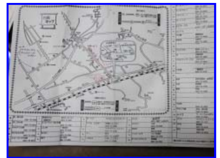
受付に有った「白馬マップ」

お勧めのお店は色々とありますが、 近場なら「白馬飯店」、「香林亭」などがあります。 和食（ランチ）なら「山ヤ」がおすすめ！ 信州に来たのだから日本蕎麦が良いという方や餃子で一杯、ラーメン という方々には個別での案内は割愛させていただきますが、白馬ハイツ受 付に案内マップがありますのでご確認の上、白馬散策がてらお出かけ