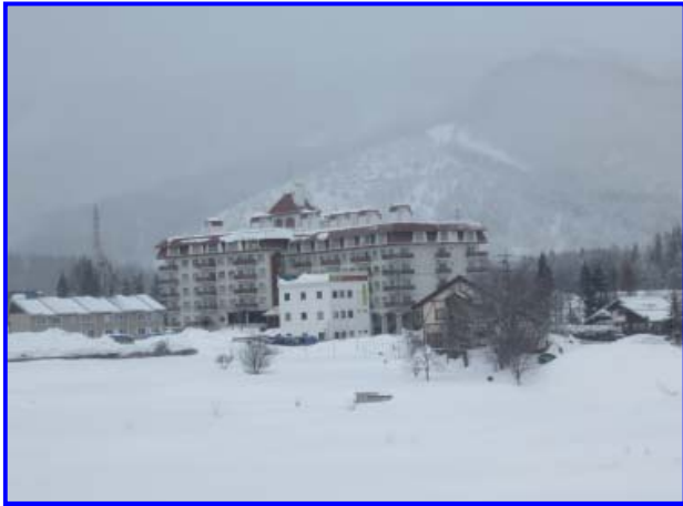
雪景色の白馬ハイツ 周辺に建物が無いから目立ちますよね！