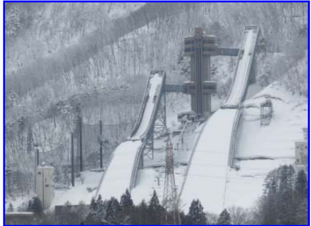
冬季長野オリンピックジャンプ台