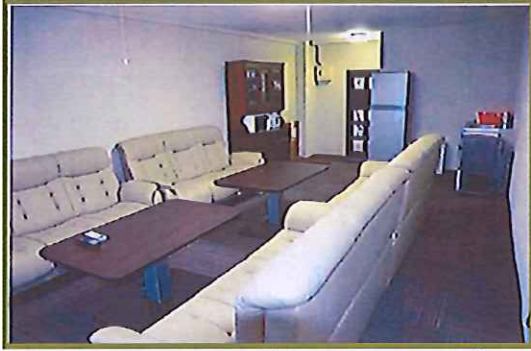
(12人まで座れるソファ)