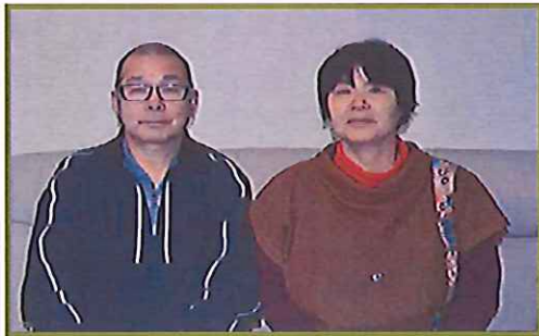
(新管理人 萩田夫妻)