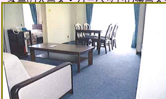
（ソファ・ダイニングセット）