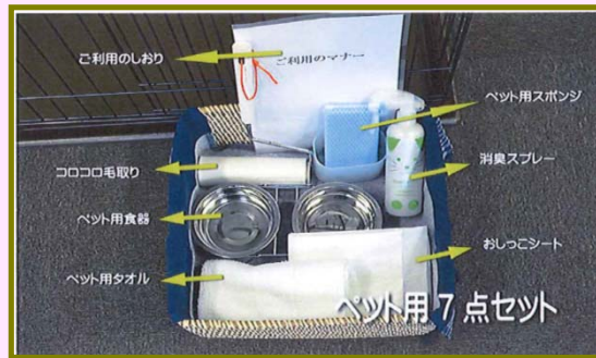
（ペット用7点セット）