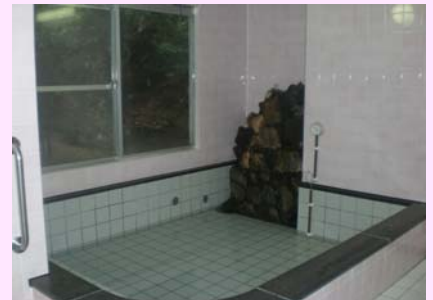
熱海ガーデンハイツ大浴場

(1) ワシントニヤ会自慢の熱海の温泉源にトラブルが発生し、当初11月初めに工事着工し、11月18日完了予定が12月20日に延期、そして年末までと変更を続けとうとうお正月までも利用出来なくなってしまい、会員の皆さんに大変ご迷惑をお掛けする事となりました。やっと施工方法が確定し、2月25日完了予定で着々と工事が進んでいます。完成の暁には、是非熱海最高温泉水をお楽しみ下さい。