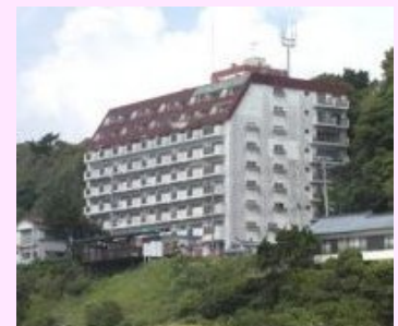
伊豆白浜大洋マンション